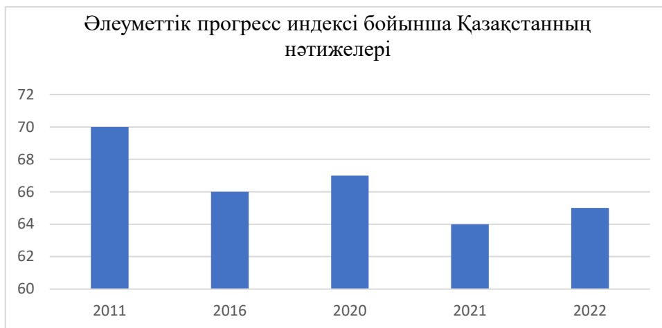
Сурет 1. Әлеуметтік прогресс индексі бойынша Қазақстанның нәтижелері

Жалпы, 12 жылдағы әлеуметтік прогрестің нәтижелері әлеуметтік прогресс тұрғысынан әлем жақсарып келе жатқанын көрсетеді, бірақ қарқын айтарлықтай баяулады. Индекстің әлемдік көрсеткіші 2011 жылғы 59,84-тен 2022 жылы 65,24-ке дейін өсті. 2017 жылдан бастап әлеуметтік прогресс қарқыны екі есеге қысқарды және ол 2023 жылы бірінші рет төмендеуі мүмкін. Әлемдегі әлеуметтік прогресс жеке құқықтарда төмендейді (-5,34) және инклюзивтілікте тоқырау (+0,32).