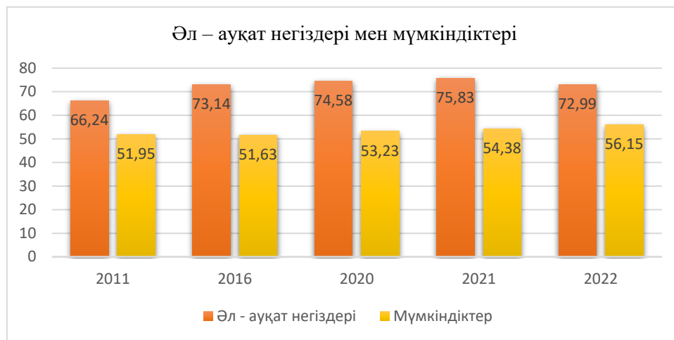
Сурет 3. Әлеуметтік прогресс индексі бойынша Қазақстанның нәтижелері (Әл – ауқат негіздері мен мүмкіндіктері)

норма, белгілі бір еңбек бірлігі ретінде қабылданады. Осындай нормативті қабылдау арқылы, әртүрлі факторларды ескеріп, қоғамдың жай - күйін есептелуге мүмкін туады [6]. Әлемнің дамыған елдерінде халықтың әл-ауқалы бүгінде өте өзекті. Әлем елдері тұрғындарының өмір сүру деңгейін білуі өте маңызды. Осыған орай әр ел ішінде жеке әлеуметтік топтар өз өмірлеріне «қанағаттанғандығын» немесе «қанағаттанбағандығын» түсіну үшін халықтың әл-ауқатын бағалаудың әртүрлі әдістері қолданылады.